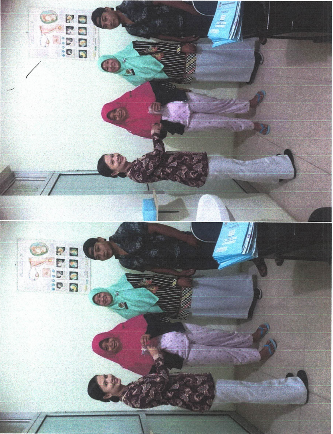
PEMBERIAN KOMPENSASI PELAYANAN