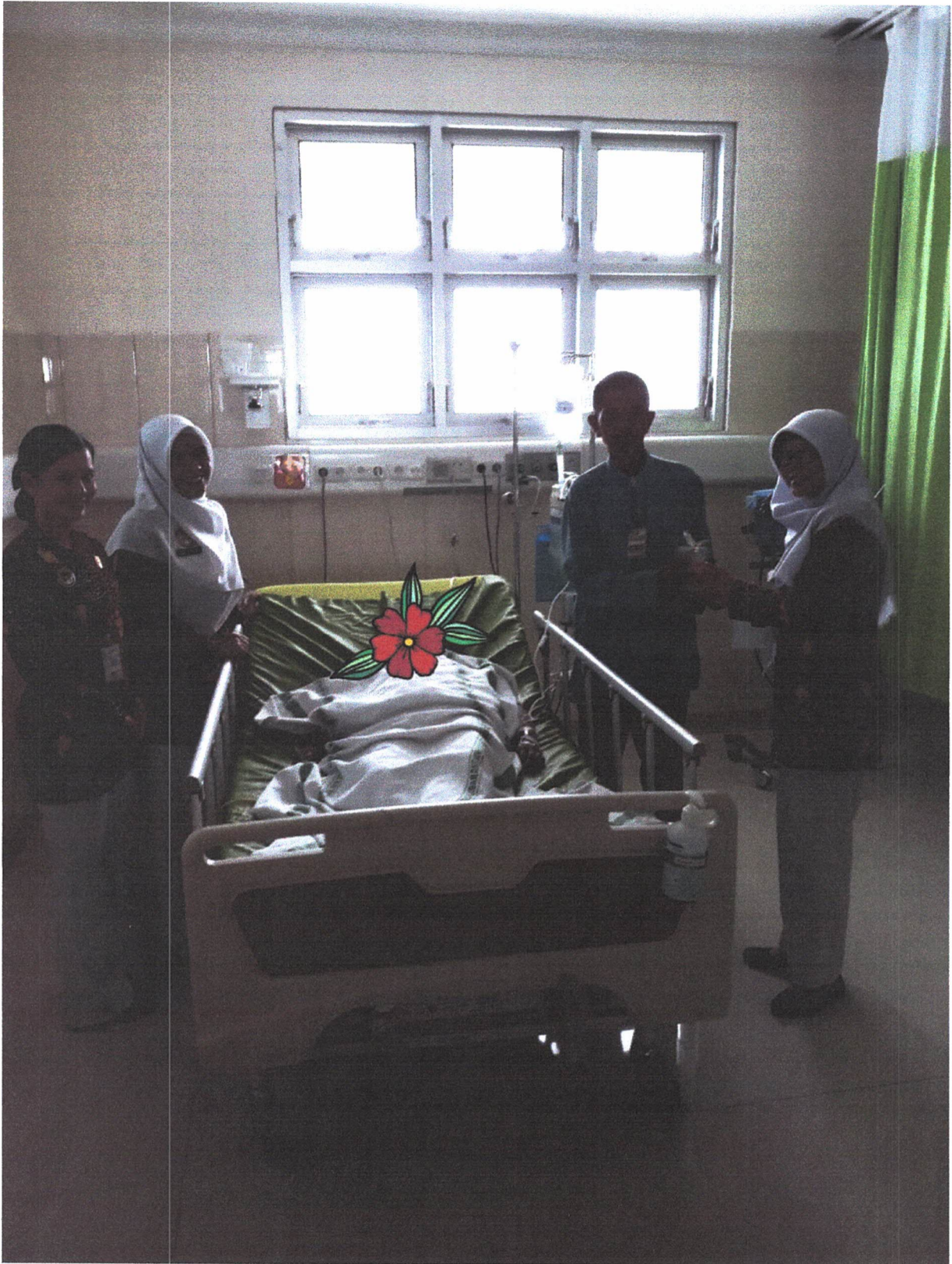
FOTO KOMPENSASI PELAYANAN